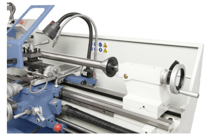
Zentrierkegel diam. 100 mm, ideal zum Spannen von Rohren und Hohlkörpern (Option)