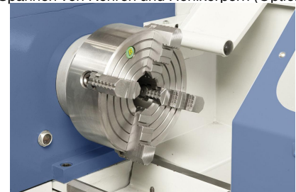
Vierbacken-Plattscheibe 200 mm mit Umkehrbacken im Standardzubehör enthalten