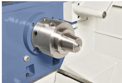
Optional lieferbar: Spannzangenfutter 5C, Spannbereich 3 – 26 mm