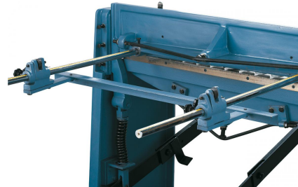
Robuster Hinteranschlag, einstellbar von 0 - 700 mm.