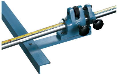
Der Hinteranschlag ist serienmäßig mit einer Feineinstellung ausgestattet