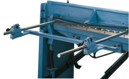
Robuster Hinteranschlag, einstellbar von 0 - 700 mm.