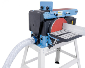
Serienmäßig mit integriertem Absaugstutzen für den Anschluss einer Absauganlage