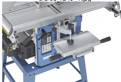
Die serienmäßige Langlochbohreineinrichtung ist unerlässlich für Schlitz- und Bohrarbeiten.