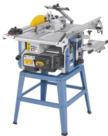
Abbildung mit optionalem Untergestell