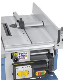
Seitlich geführter Abrichtanschlag, schwenkbar von 90° bis 45°.