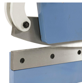
Messer aus Qualitätsstahl, gehärtet und geschliffen