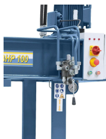
Ein feinfühliges Zustellen und Stoppen des Kolbens wird mittels Spezialhebel gewährleistet.