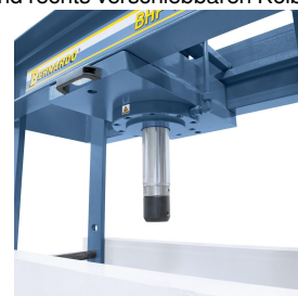
Großdimensionierter Kolben für höchste Beanspruchung.