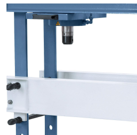
Universell einsetzbar durch den nach links und rechts verschiebbaren Kolben.