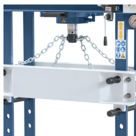
Inklusive Vorrichtung zur Höhenverstellung des Arbeitstisches.