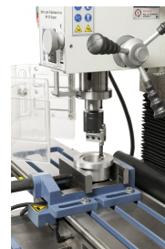
Auf Wunsch kann die Maschine mit einem Ausdrehkopf ausgestattet werden.