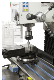
Lieferbares Sonderzubehör: Kantentaster