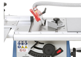
Leichtere Schnittführung des Werkstückes durch das nach links schwenkbare Sägeblatt.