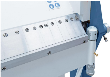
Gehärtete und geschliffene Segmente sorgen für ein exaktes Biegen.