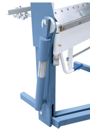
Ein Hilfszylinder unterstützt den Biegevorgang beim Abkanten.