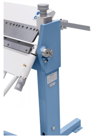
Die Einstellung der gewünschten Materialstärke erfolgt schnell und einfach mittels Einstellschraube