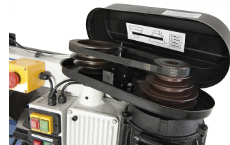
Mittels Keilriemen kann die Bandgeschwindigkeit schnell und einfach gewechselt werden.