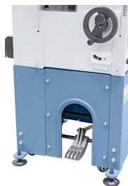
Serienmäßig mit Lenkrollen und Feststellbremse ausgestattet.