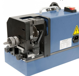
Schleifen der Stirnfläche