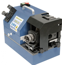
Schleifen der Anschnittlänge