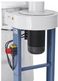
Leistungsstarker Motor mit Stahllüfterrad