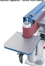
Rundscheifertisch mit Absauganschluss ideal zum Schleifen von Radien und Konturen.