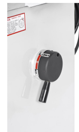
Komfortables Umschalten von Stufe 1 auf Stufe 2