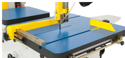
Längsanschlag für Geradeschnitte und Gehrungsanschlag für Winkelschnitte serienmäßig