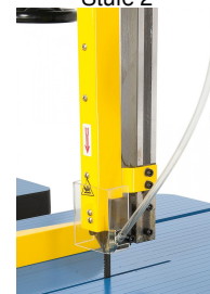
Inklusive Ausblasvorrichtung für optimale Sicht auf die Schnittlinie