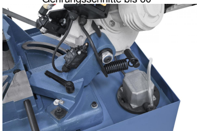
Kühlmittleinrichtung im Lieferumfang enthalten