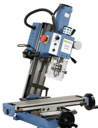
KF 20 L mit geschwenktem Fräskopf für erweiterten Einsatzbereich (Standard)