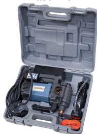
Lieferung in hochwertiger Transportbox.