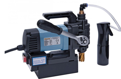
Eine Ratsche erleichtert das Arbeiten bei eingeschränkten Platzverhältnissen.