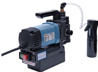
Verwechslungsfreie Anordnung der Schaltelemente an der Rückseite der Maschine.