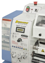
Elektronisch, stufenlose Drehzahlregelung, leichtes Ablesen mittels Digitalanzeige.