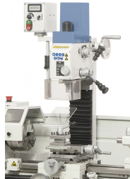
Fräsaufsatz FA 25 optional lieferbar. Technische Daten siehe Proficenter 700 BQV.