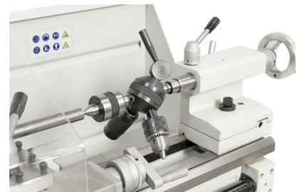
Zum wirtschaftlichen Arbeiten kann die Maschine mit einem Revolverkopf ausgestattet werden