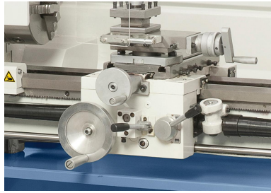
Ergonomisch angebrachte Schalthebel zur Einstellung des Längs- und Quervorschubes.