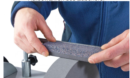
05-2050 Schleifstein: Dient zum Präparieren der Schleifscheibe (fein/grob)