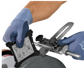
Einfaches Einstellen des optimalen Winkels mit der Winkellehre WL-60 (Standard).