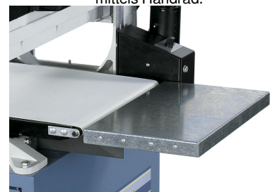
Vergrößerte Auflagefläche durch beidseitige Tischverlängerungen.