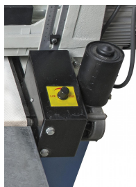
Variabel einstellbare Vorschubgeschwindigkeit