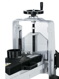
Stabiles Führungssystem, Höhenverstellung mittels Handrad.