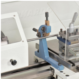
Die mitlaufende Lünette verhindert das Durchbiegen von dünnen Wellen.