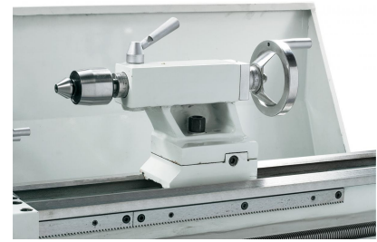
Für universellen Einsatz ist optional eine mitlaufende Körnerspitze Type SMA mit 7 auswechselbaren Einsätzen lieferbar.