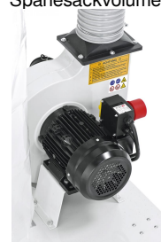
Leistungsstarker Aluminium-Motor, besonders laufruhig