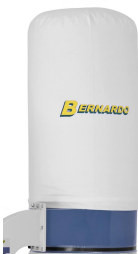
Geringer Staubdurchlass durch gewebten Fein-Filtersack