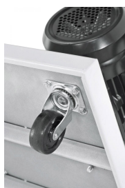
Fahreinrichtung mit Lenkrollen serienmäßig