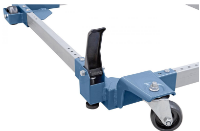
Serienmäßig mit Lenkrollen und Feststellbremse ausgestattet.